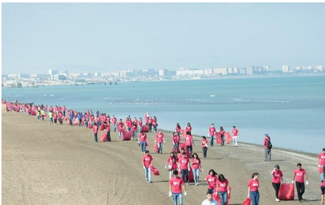
Image 2 : Participants au World CleanUp Day sur une plage d'Estonie

C'est ainsi que le 15 septembre 2018 , partout dans le monde, des millions de citoyens vont participer à la plus grande mobilisation citoyenne et environnementale de l'histoire, en agissant collectivement pour nettoyer la planète.